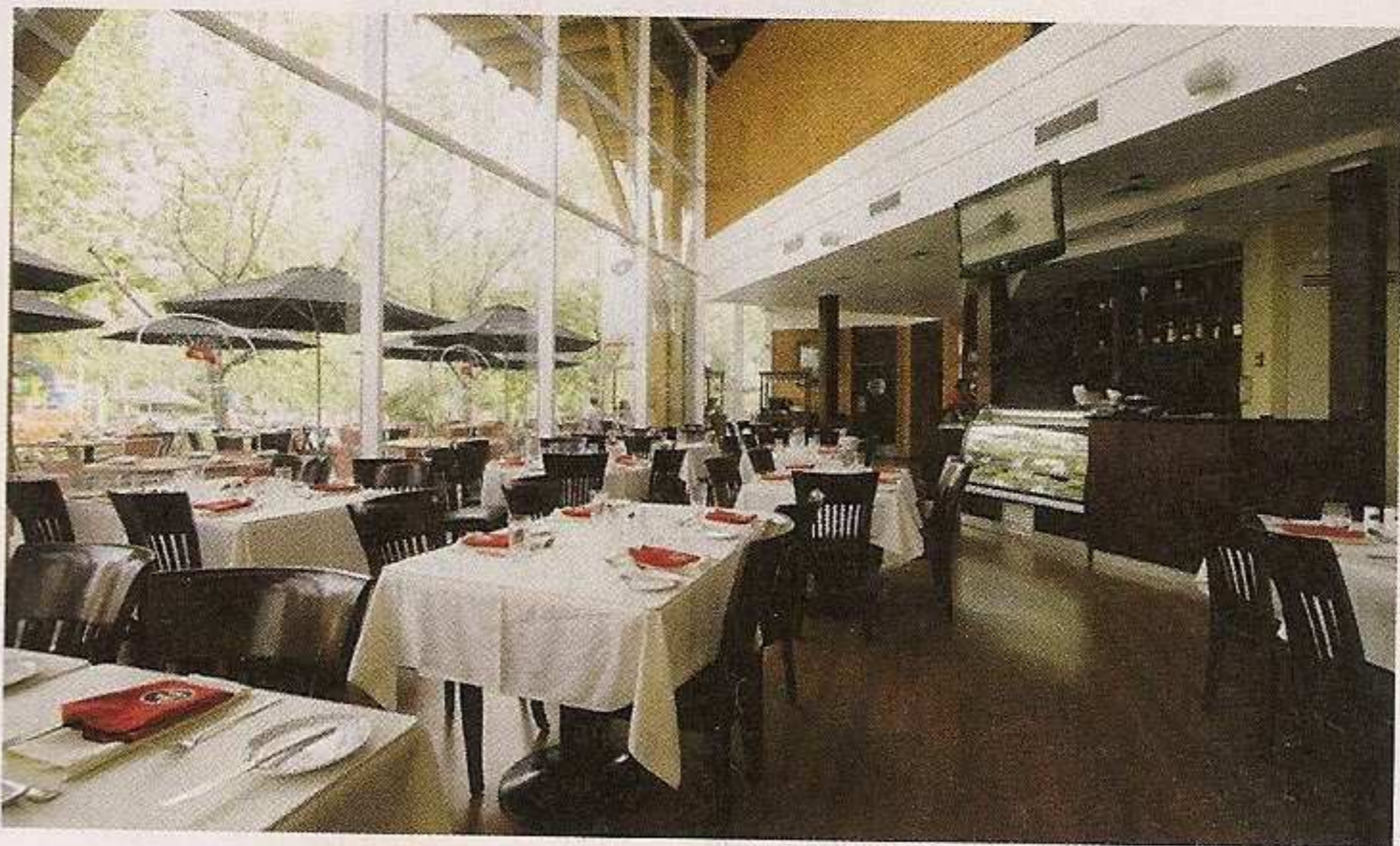
Pasta e Basta , Shopping La Dehesa. El Rodeo 12850, Lo Barnechea, fono 394 2000.

De postre pedimos un gran pie de limón que estaba bien rico, la verdad. El lugar estaba repleto y la gente se veía contenta. Cuando llegó la cuenta, comprendimos. Consumo promedio por persona: $ 10.350 (jugo + plato de pasta + postre).